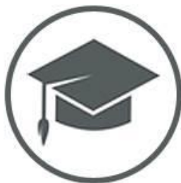
Genetics in the Classroom