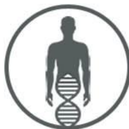
Human Genetic Research