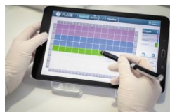
1.ピペティングプランの作成