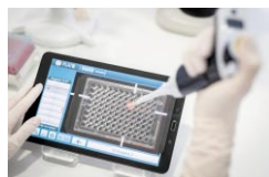
3.ピペティングの開始