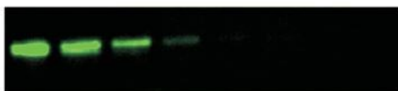
Alexa Fluor® 647 Protein Labeling Kit Invitrogen™ Molecular Probes®