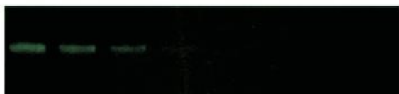
Amersham Cy® 5 Ab Labelling kit GE Healthcare

ヒトトランスフェリン 蛍光ウエスタンブロット検出 イメージャー : ImageQUANT™ LAS 4000 GEHC