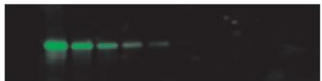
Fluorescent Western blotting