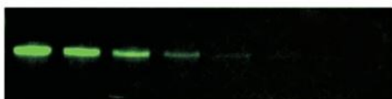
SMART 645 - Antibody Labeling kit – Cyanagen