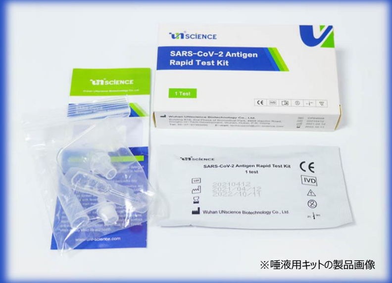
※唾液用キットの製品画像