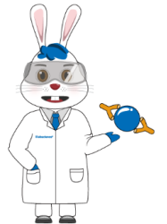
Elabscience マスコット "Erie"

Elabscience社は免疫診断技術を専門としています。研究開発と製造のためのプラットフォームがあり、すべての製品において社内QCを実施し、実験結果の一貫性と正確性を維持するよう努めています。製品は全世界100カ国以上で販売されており、豊富な製品数と厳密な管理により実現された高い品質が特徴です。また、Nature、Cell、Circulationなどを含む多くのトップジャーナルによって8000本近い論文の引用実績があります。