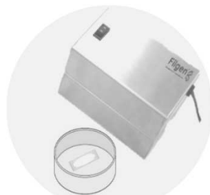
UVオゾンクリーナーをシャーレの上に被せ、電源をオンにし洗浄開始。

専用のサンプルホルダーや特注仕様のご相談についてもお気軽にお問い合わせください。