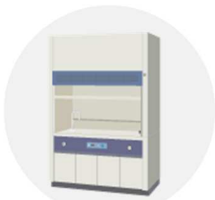
ドラフトチャンバーなど排気設備内で必ずご使用ください。