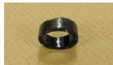
染色時間: 60分 濃度: 5