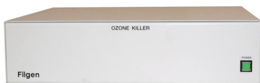
● オゾン分解装置〈オゾンキラー〉

波長184.9 nmの紫外線照射により、有機物質の化学結合が切断されるとともに、空気中に存在する酸素分子が分解され、酸素原子となります。この酸素原子は、もともと存在する酸素分子と結合してオゾン分子を生じます。さらにこのオゾン分子に対して波長253.7 nmの紫外線が照射されることにより、活性酸素が生成されます。活性酸素は、基板表面の有機物と結合してCO 2 等の揮発性分子となり、基板表面から離脱します。