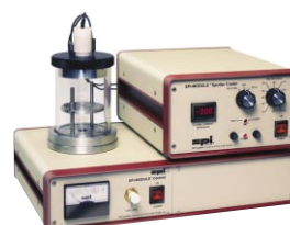
● Sputter Coater