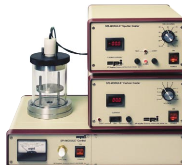
● Sputter / Carbon Coater